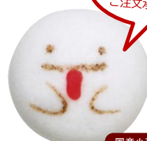
おばけまんじゅう