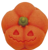
かぼちゃランタン